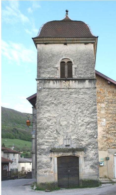
Simulation infographique de la restauration