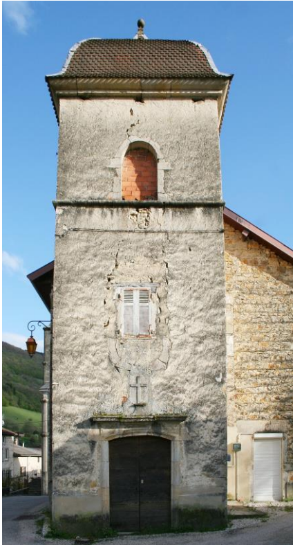
Etat de la façade du clocher en 2014

Notre village présente une particularité architecturale: le bâtiment de la mairie possède un clocher ! En effet, l'ancienne église: « Notre Dame de l'Abergement » fut transformée en école puis en mairie. Une nouvelle église ayant été construite, nous voici devenu « le village aux deux clochers » !