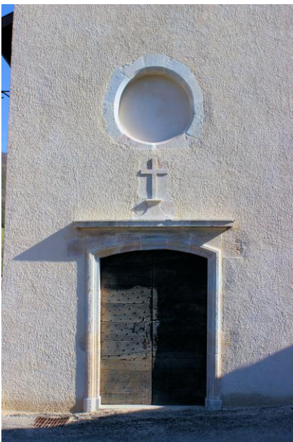
Le porche et son oculus

L'occulus est maintenant paré d'une superbe ferronnerie d'art qui le met particulièrement bien en valeur.