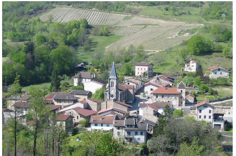
L'Abergement de Varey et ses deux clochers