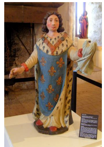
Saint Louis XVII s Inscrit aux MH le 29 septembre 1992

Statues de bois polychrome exposées en 2011 au Château des Allymes propriété de la commune de l'Abergement de Varey