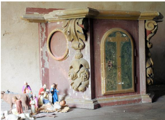
Tabernacle probable de l'ancienne église conservé dans une des chapelles de la nouvelle église.

Le 3 messidor An III de La République, Louis Étienne Barbolat, procureur de la commune a rendu compte des effets mobiliers de la sacristie, de la cure ainsi que des débris du clocher abattu lors de La Révolution.