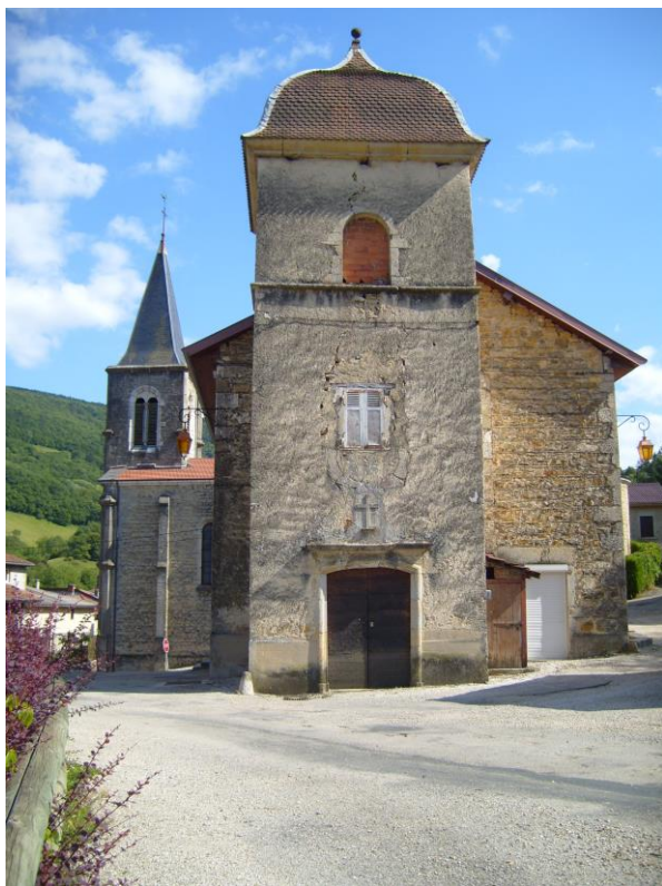
Le clocher de la mairie avant sa restauration qui débutera en 2015

Le 21 août 1861 le maire expose au conseil les arguments donnés pour obtenir de nouvelles subventions : « notre vieille église dégradée par les fuites d'eau et l'humidité du terrain est encore venue à menacer ruines de toutes parts et nous avons été mis dans la nécessité de la rebâtir de suite si nous ne voulions pas la voir tomber entièrement. Nous sommes encore sans maison d'école pour les garçons et sans maison communale, nous voulons donc, par économie, en construire une en faisant servir les matériaux de notre vieille église. »