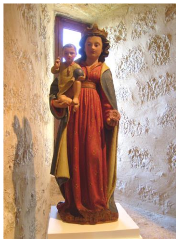
Vierge à l'enfant XVI s Inscrite aux MH le 13 janvier 1992