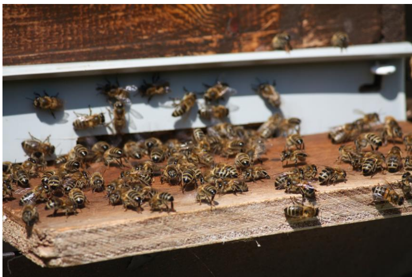
Retour à la ruche protégé par les abeilles gardiennes qui attendent les faux bourdons et les intrus afin de leur barrer la route. Elles se placent toutes dans la même position face à l'entrée, l'abdomen dressé et les ailes en perpétuel mouvement.