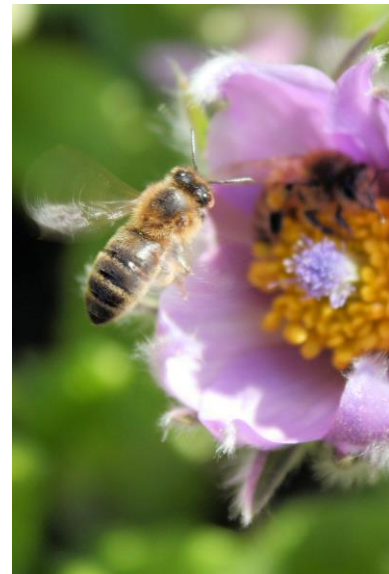
L'Apis mellifera (ou abeille domestique) possède cinq yeux pour sa vision panoramique et un système de poche à pollen sur ses pattes arrière.

La survie des abeilles dont dépend toute la chaîne de biodiversité, donc la survie des espèces, est menacée. A nous de réagir rapidement : protégeons-les.