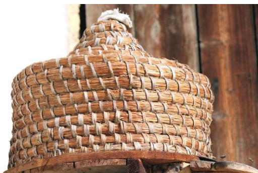
Une ruche ancienne toujours en service !

La survie des abeilles dont dépend toute la chaîne de biodiversité, donc la survie des espèces, est menacée. A nous de réagir rapidement : protégeons-les.