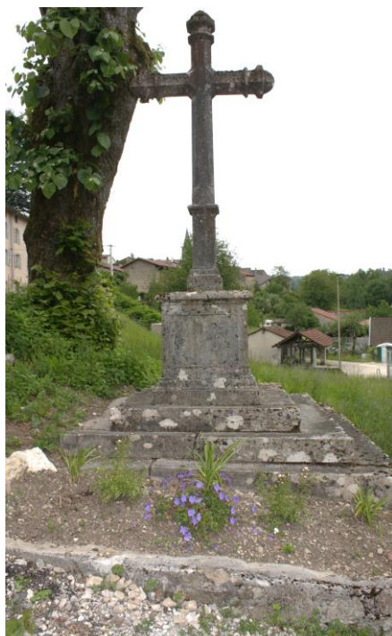
La croix du château

La croix du château installée sur un terrain qui était alors privé porte la mention : « O crux ave H. C. 1868 »