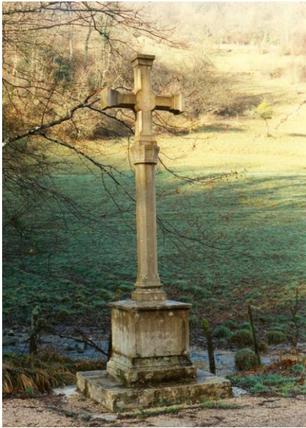
La Croix Ste Marie avant sa restauration en 2004

Ce petit patrimoine mérite notre attention puisqu'au-delà de sa connotation religieuse ce sont avant tout des témoignages de notre histoire.