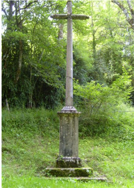
La croix des Inversiers