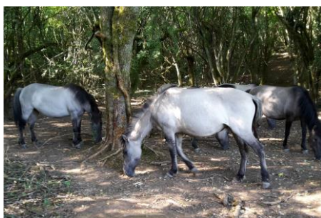
Les tarpans se tiennent souvent à l'ombre de nos sous-bois.

Avec l'appui technique de la S.E.M.A. (Société d'Economie Montagnarde de l'Ain) et de la Chambre d'agriculture, l'A.F.P. s'est chargée de la création de quatre parcs (clôtures barbelées, passages piétons, portails, abreuvoirs, signalétique) afin que les tarpans puissent s'installer en toute tranquillité. Le financement de cette opération de 23 631,96 euros T.T.C. a pu se faire grâce aux subventions de l'Union Européenne, de la région Rhône-Alpes et du Conseil Général de l'Ain, l'association « Arthen Bugarbivore » prenant à sa charge 27% du coût global. C'est l'entreprise MOREL BTP, de Château-Gaillard, qui a réalisé les travaux d'aménagement.