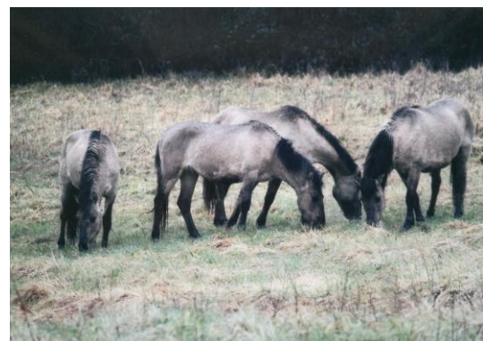
Bien groupés, ils se sont mis rapidement à brouter