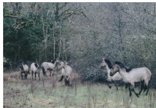
L'arrivée des tarpans