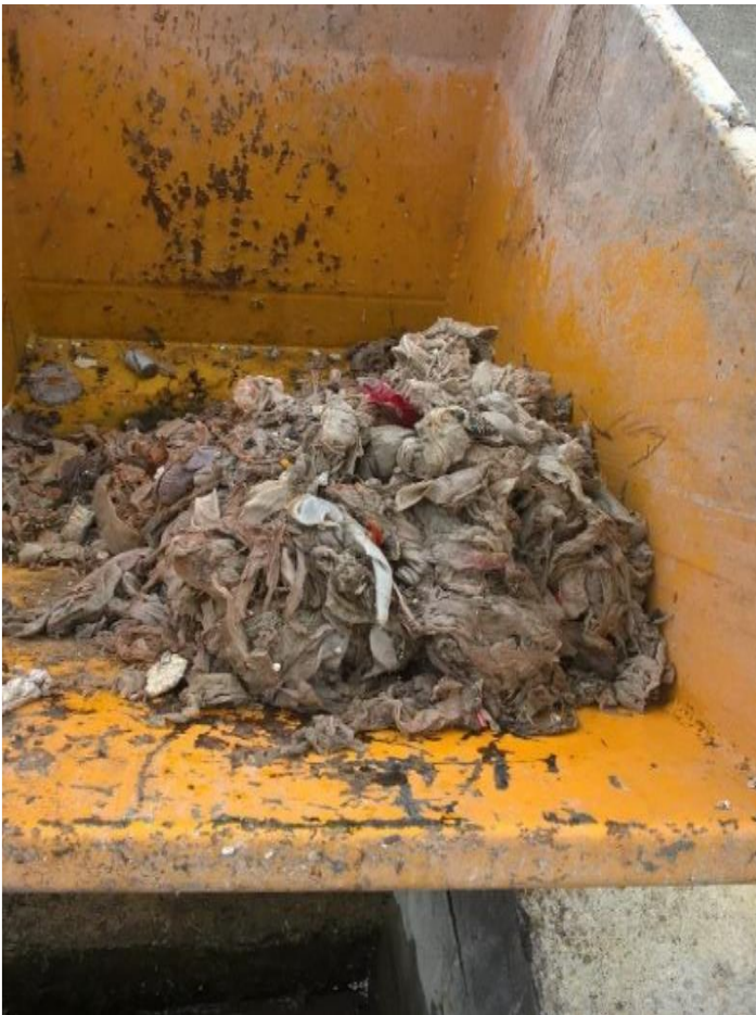
Refus de dégrillage en entrée de station d'épuration

Les structures ne sont pas adaptées pour recevoir de tels objets, ce qui engendre donc des problèmes techniques et des surcoûts de main d'œuvre.