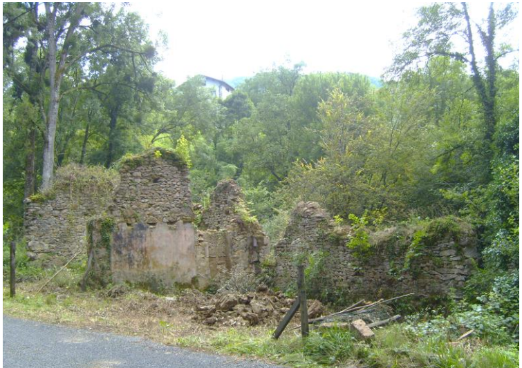
Etat des ruines en 2008

Mais sa fabrique, a souvent connu des difficultés d'approvisionnement en eau, ainsi que le prouvent la convention d'aménée d'eau passée par le sieur Pignon avec d'autres propriétaires le 04 janvier 1880 (car la conduite devait traverser leurs terrains) ainsi que la pétition de 1822 que Pignon a intenté contre le sieur Janton propriétaire du moulin situé chez Gavet (Moulin Perrin actuellement).