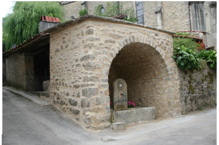
La fontaine du Bourg en 1928 et en 2014

Lors de la séance du conseil municipal du 2 août 1857, « Les habitants du quartier dit du village de l'Abergement demandent au conseil municipal que les eaux de la fontaine de Bourbouillon soient amenées jusque sur la place publique. Ils se chargent eux-mêmes des travaux nécessaires. Le conseil leur fait observer que ces eaux sont communes avec les habitants de "La Forêt" et qu'il ne faut pas favoriser les uns au détriment des autres. Ce à quoi les habitants du village disent qu'il se perd actuellement beaucoup d'eau et qu'ils s'engagent à construire un réservoir qui partagera par moitié l'eau de Bourbouillon entre l'écoulement existant et la future fontaine du village. Que la canalisation de liaison sera à leur charge et qu'ils en seront responsables pour son entretien. Le conseil donne son accord. »