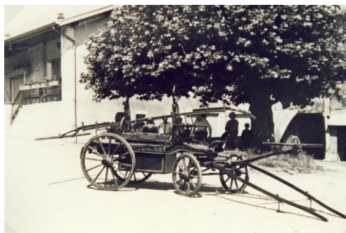
La pompe à bras de l'Abergement de Varey

Le conseil décide qu'une subvention de 112,05 francs sera affectée à l'achat et l'entretien du matériel d'incendie.