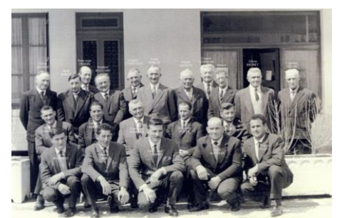
Repas des pompiers de 1966