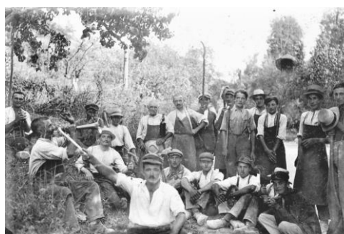
Retour après un feu en Fayat